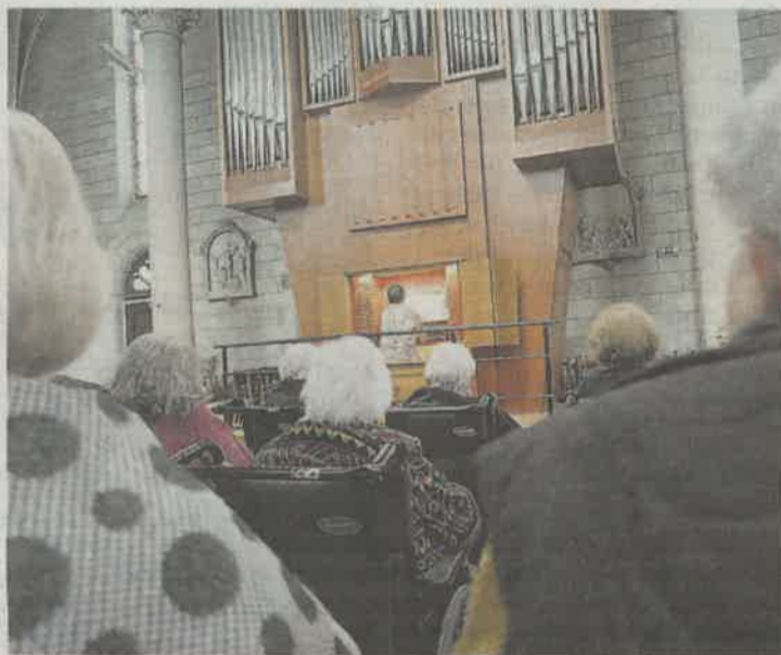
Les résidents ont apprécié cette parenthèse musicale.

« C'est l'aumônerie de la maison de retraite qui est venue vers nous. On a accepté sans problème », sourit-elle, ravie de présenter le majestueux instrument, arrivé l'an dernier au cœur de l'église Saint-Pierre-et-Saint-Paul du centre-ville de Joué-lès-Tours.